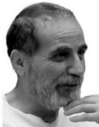
Erdogan Ahmet Autor)

Selección de escritos de Lenin y Stalin investigados y recopilados para diversos artículos sobre el tema. E. A